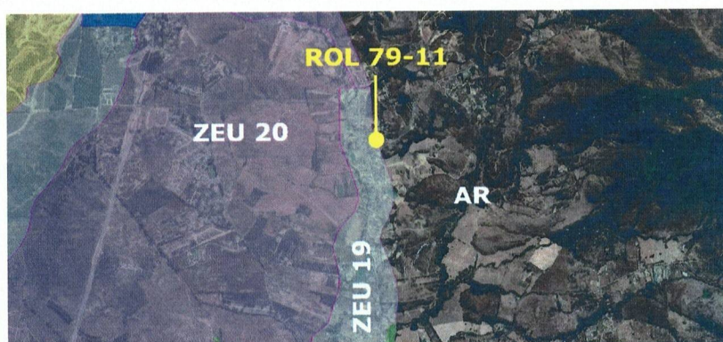
Imagen 1 - Predio con zonas del PIV-SBCN. Elaboración propia.

Analizada la delimitación de las zonas del PIV-SBCN sobre el predio, consta que este se encuentra parcialmente normado por la zona ZEU 19 y AR, según se indica en la imagen siguiente: